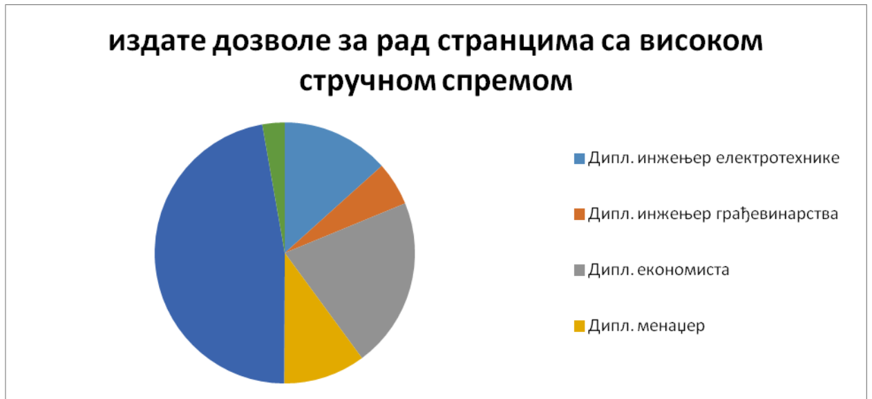
dozvole za rad izdate strancu sa visokom stručnom spremom

Analiza napred navedenih podataka pokazuje svakako pozitivne efekte primene Zakona o zapošljavanju stranaca, koji daju mnogo precizniju sliku o broju i kretanju stranaca koji ostvaruju prava po osnovu rada u Republici Srbiji, imajući u vidu potpuno uređivanje materije koja se odnosi na zapošljavanje stranaca i ostvarivanja prava na rad.